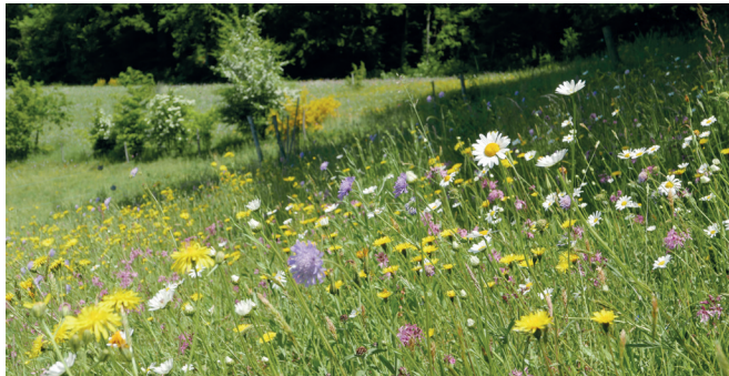
Blumenwiese in Ludligen