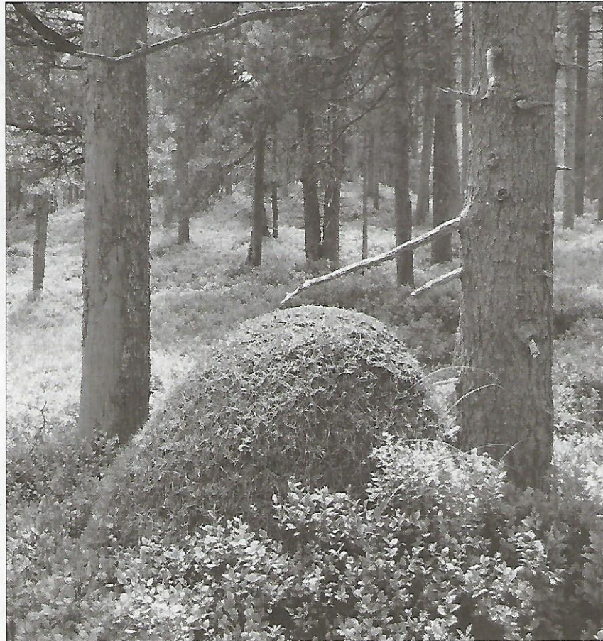
Prächtiger Ameisenhaufen in einem Moorwald bei der Alp Guggenen in Flühli.

Im Entlebuch gibt es mindestens zwei hügelbauende Arten, am häufigsten kommen die Rote und die Kahlrückige Waldameise vor. In der Schweiz leben acht Arten, die alle geschützt sind. Ein grosses Volk mit einer Million Tiere sammelt rund 100 000 Insekten pro Tag, das gibt 30 bis 50 Kilogramm in der Saison. Sie ernähren sich zusätzlich von rund 200 Kilogramm Honigtau, der von Blattläusen erzeugt wird. Wo die Waldameisen fehlen, wird bis zu einem Fünftel weniger Waldhonig geerntet. Die Ameisen sind ein wichtiger Bekämpfer der Borkenkäfer und sie helfen mit, bis zu 150 Pflanzenarten zu verbreiten. Es gibt den Spruch, der das Wirken der kleinen Tiere prägnant zusammenfasst: «Die Waldameisen fressen den Wald gesund!» [rip]